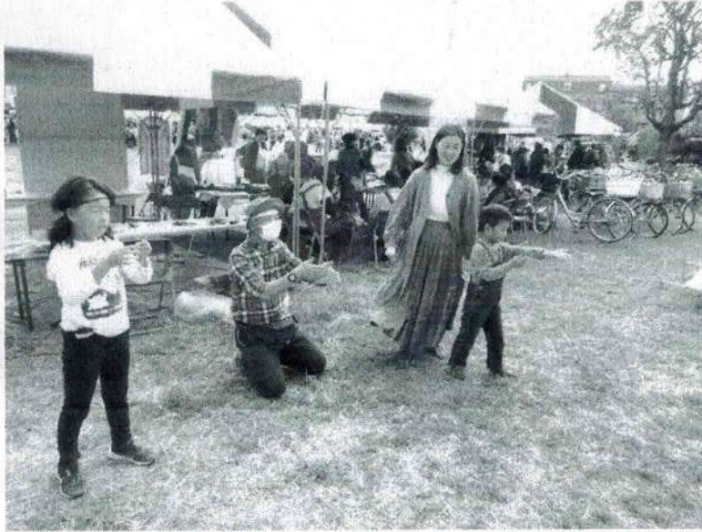
4年振り開催の環境フェアで竹とんぼを飛ばすこどもたち

ぼくは10月にかんきようフェアのお手伝いをしました。エコクラブでは、まつぼっくりとどんぐりのかざり、竹とんぼ、竹のペン立てなどを作るお店をしました。まずそのねだんをきめました。そしてかんばんを書きました。いすやつくえをならべておみせをひらくじゅんびもしました。いよいよおみせがひらくと、おきやくさんがたくさんきました。どれもだいにんきで、じゅんばんまちのおきやくさんもいました。あんないやせつめいがたいへんだったけど、たくさんきてくれてう