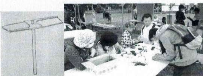
親子で楽しく竹工作しています(環境フェア会場)

竹を削るのにナイフを動かすのが最初は怖かったけれど、だんだんと上手に動かせるようになりました。羽の部分は竹の板の真ん中に持ち手の棒をさす穴をドリルであけます。ドリルを使うのも緊張しました。位置を真ん中にしないと仕上がった時に飛ばないので慎重にあげました。左右を薄く表と裏を削っていきます。このときも均等に削れているか傾きを確認しながら慎重にやりました。